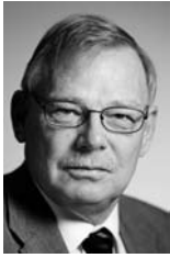
Af Bjarne Spiegelhauer, Dansk Gasteknisk Center a/s